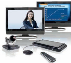
LifeSize Express 220: