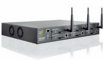
Viprinet Multichannel VPN Router 1610: